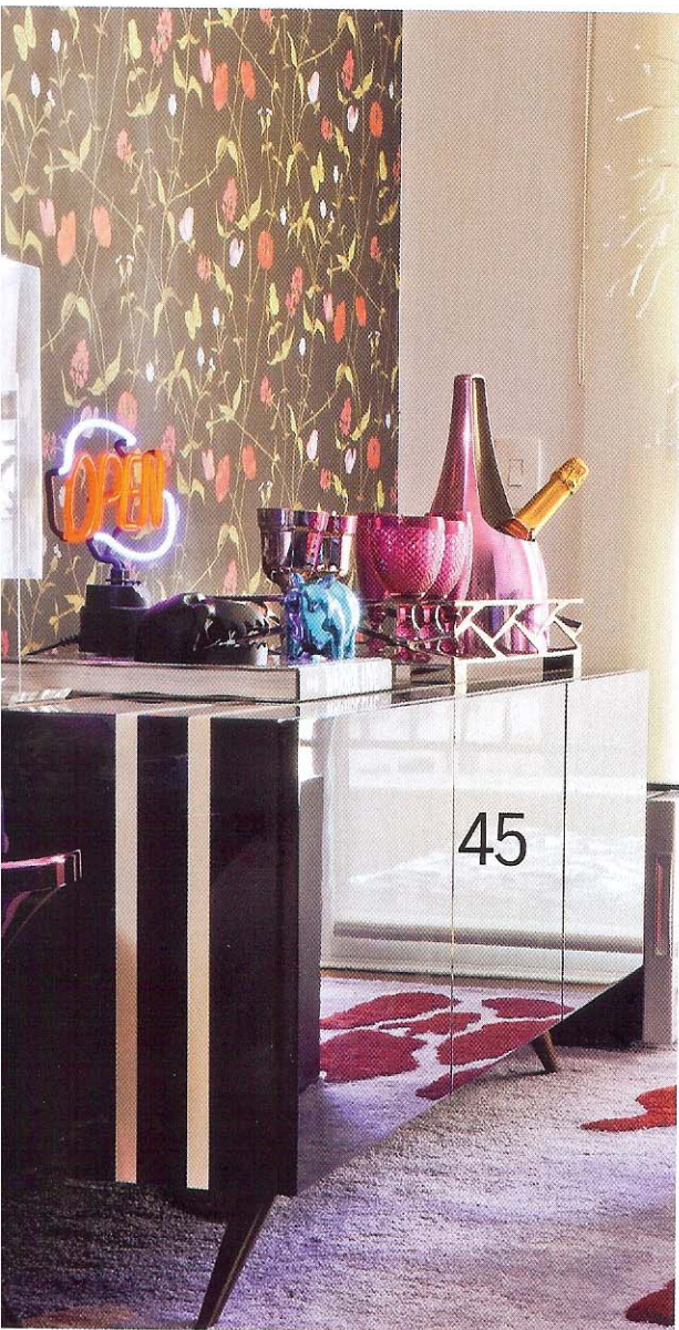
Sobre o bufê , luminária da Coisas da Doris. A bandeja, os copos e o balde de gelo são da Conceito Firma Casa. Banqueta rosa da Benedixt

Texto Gabriela Pestana Repórter de imagem Viviane Gonçalves Fotos Carlos Piratininga